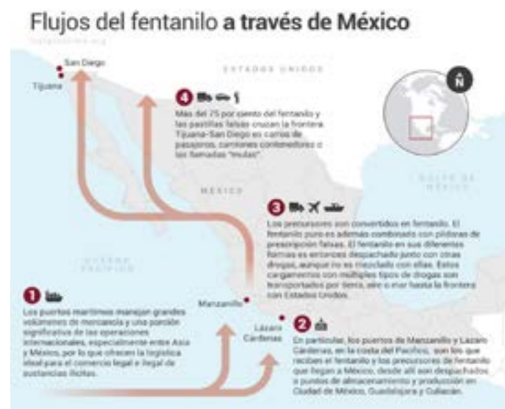
Gráfico 1. Rutas del fentanilo

El auge del tráfico de fentanilo a Estados Unidos ha cambiado las rutas del narcotráfico, desplazando a la ruta que venía de Sudamérica con cocaína, por la que viene desde Asia con precursores para la elaboración del fentanilo. En ese sentido, los puertos estratégicamente ubicados en el Pacífico y con cercanía a Estados Unidos cobran particular relevancia, como puede verse en el gráfico 1.